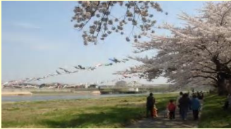
No.27 展勝地の桜並木と北上川 立花自治振興協議会

2kmもの桜並木は多くの市民や観光客に親しまれている北上の顔であり、また、雄大な北上川の流れも身近に楽しむことができる。