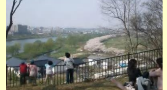
No.29 桜並木を望む陣ヶ丘 立花自治振興協議会

昔は「臺山」と呼ばれた花見の名所で、桜やツツジを楽しむことができるほか、2kmもの桜並木や北上川を一望することができる。