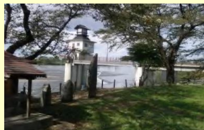
No.28 豊稜の源 頭首工公園 立花自治振興協議会

日本の疎水百選にも選ばれており、和賀川と北上川の合流点の雄大な景観を見ることができるほか、江刺平野開削の歴史も感じることができる。