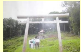
No.76 北上を一望 新山観音堂 立花自治振興協議会

新山観音堂は新渡戸稀造ゆかりの神社であり、急な斜面の中腹に位置したこの境内からは、遠く岩手山まで望むことのできる眺望点となっている。