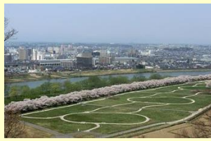
No.74 展勝地と市街地を望むウォーキングコース 立花自治振興協議会

新設した展勝園から博物館につながるウォーキングコースからは、展勝地や北上市街地を一望できる。