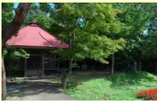
No.30 国見山文化を映す毘沙門堂 立花自治振興協議会

国見山極楽寺文化を伝える重要な施設であり、大イチョウや花壇などによって四季の彩りも感じることができる。