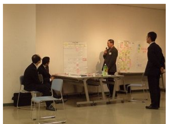
なぜその配役になったのかを報告