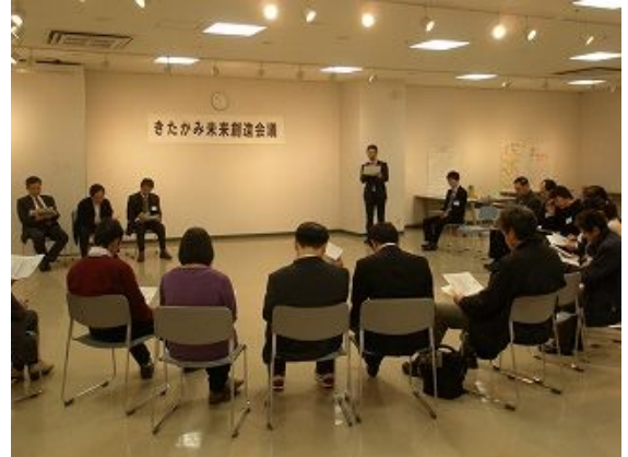
ロジックモデルの説明