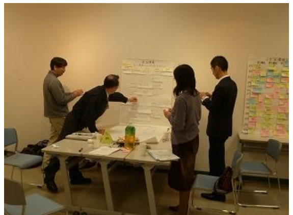
主演・準主演・助演の分類