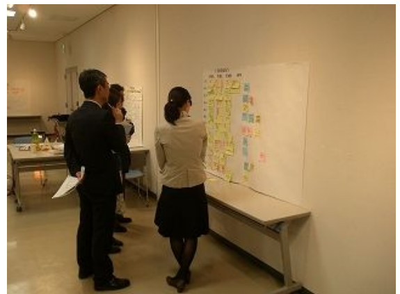
前回意見交換の確認